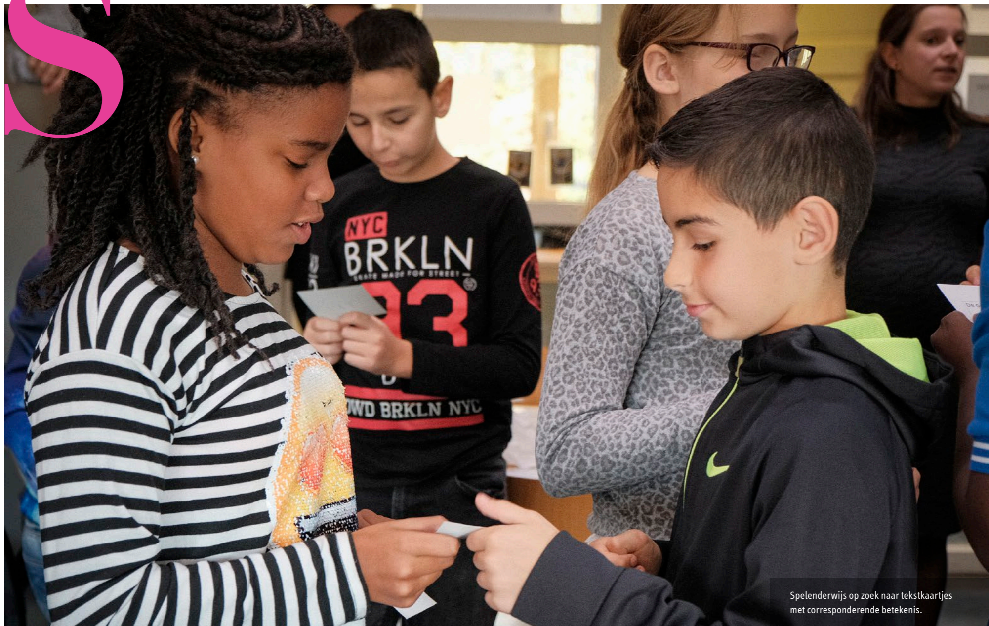
Spelenderwijs op zoek naar tekstkaartjes met corresponderende betekenis.