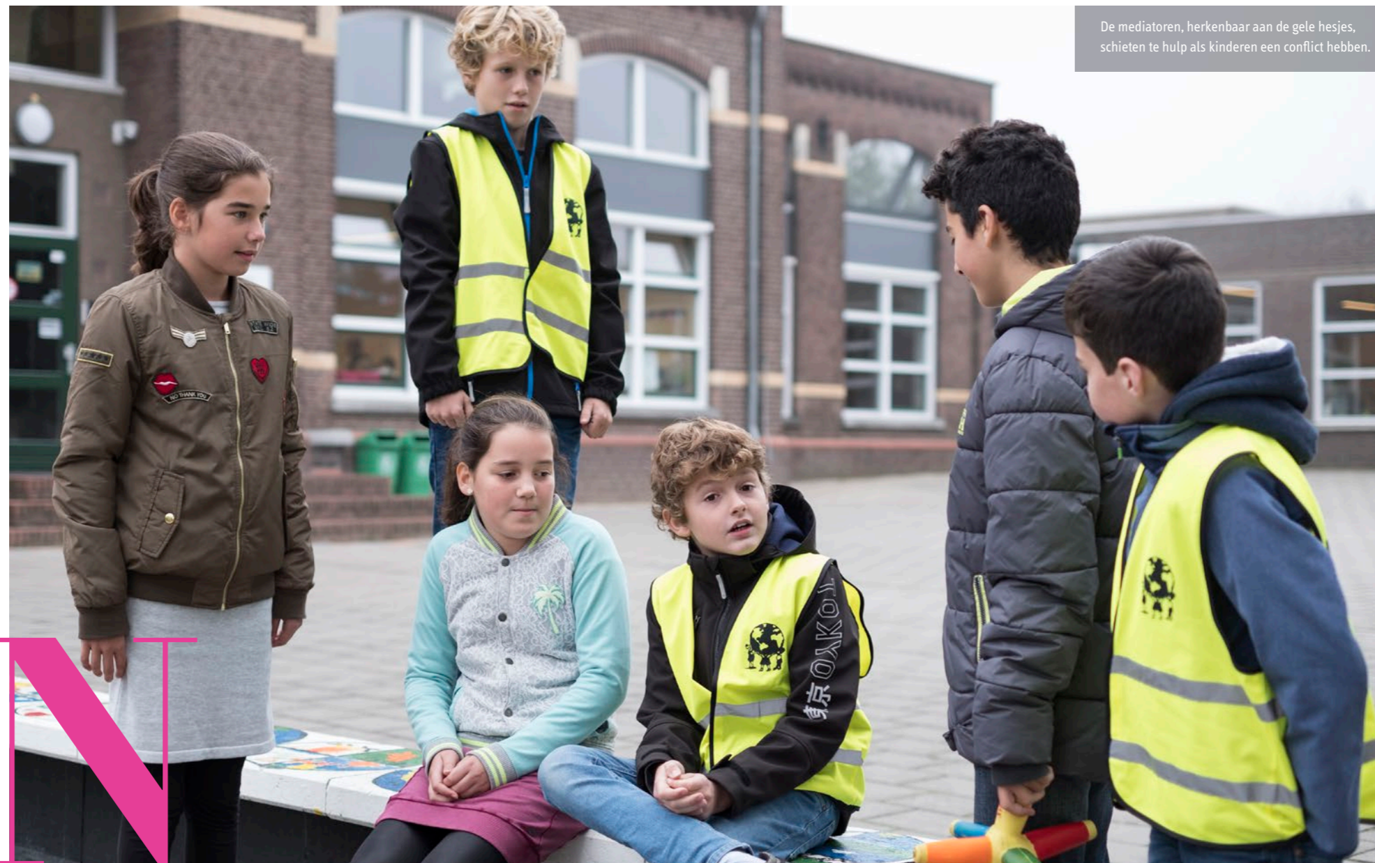
De mediators, herkenbaar aan de gele hesjes, schieten te hulp als kinderen een conflict hebben.