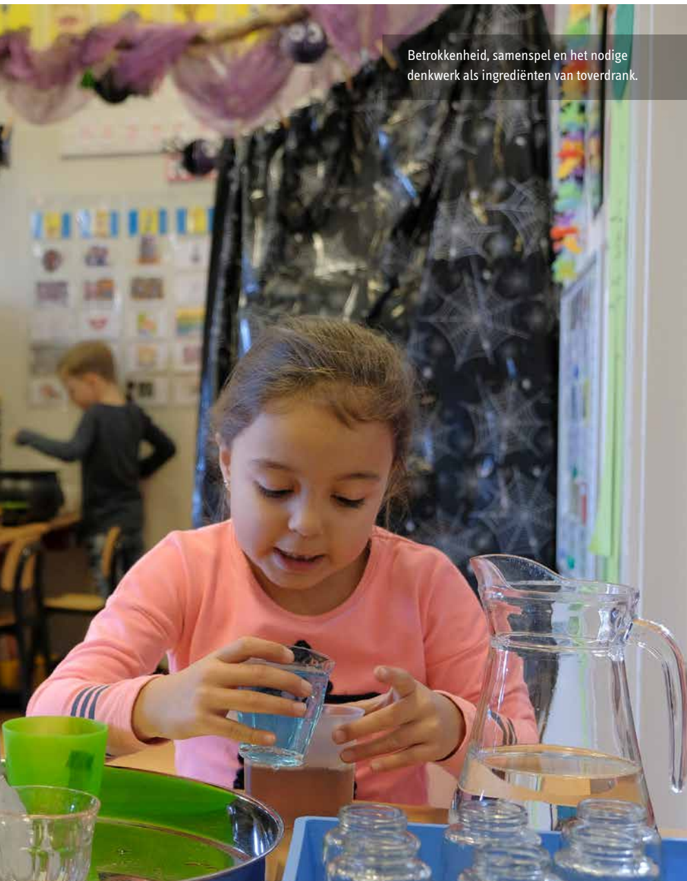
Betrokkenheid, samenspel en het nodige denkwerk als ingrediënten van toverdrank.

Meer informatie bij: MirandeNeijns@bco-onderwijsadvies.nl