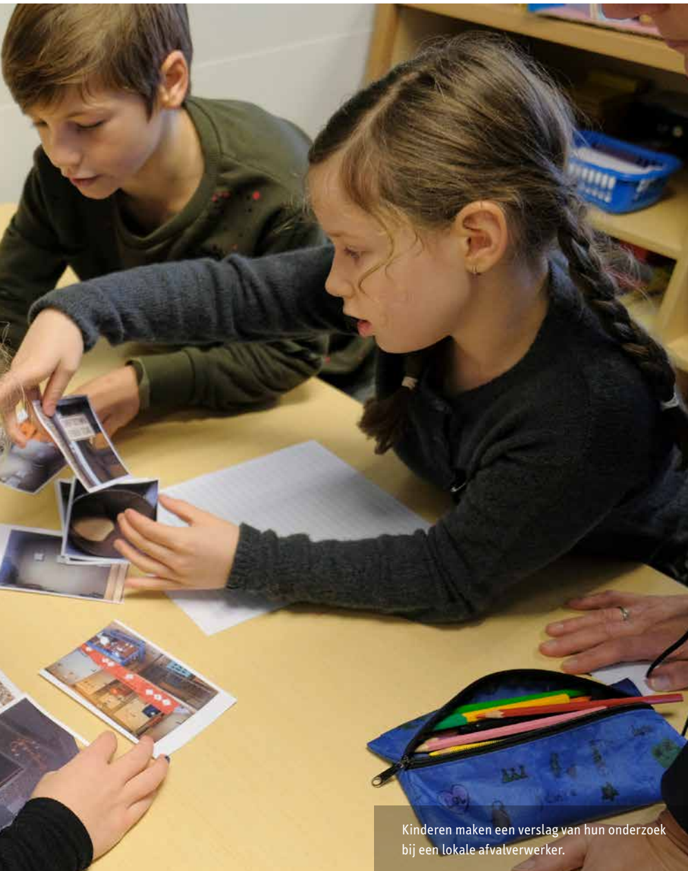
Kinderen maken een verslag van hun onderzoek bij een lokale afvalverwerker.

Meer informatie bij: MarliesdeWever@bco-onderwijsadvies.nl