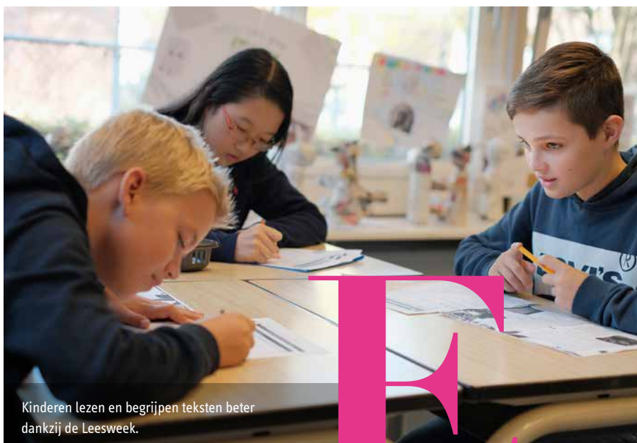
Kinderen lezen en begrijpen teksten beter dankzij de Leesweek.

Eén tekst waarmee je een hele week werkt aan zowel technisch als begrijpend lezen, aan woordenschat en wereldoriëntatie. Dat is de essentie van de Leesweek. Basisschool 't Palet in Blerick zag het leesniveau én -plezier van kinderen enorm stijgen dankzij deze aanpak.